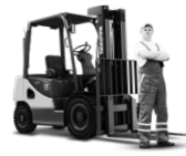
Manejo de materiales